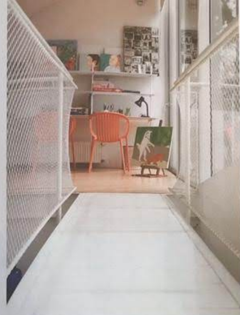
EN EL SEGUNDO nivel se genera un altito donde los niños pintan y junto al cual hay un deck que crea continuidad con el jardín.