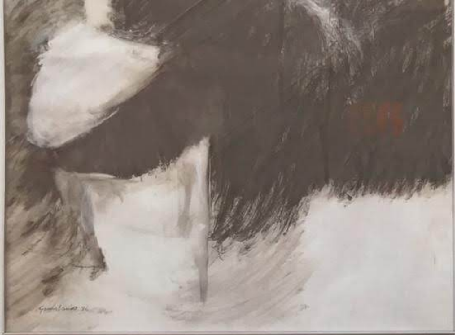
EN EL LIVING, UN GRAN CUADRO DE GRACIA BARRIOS.